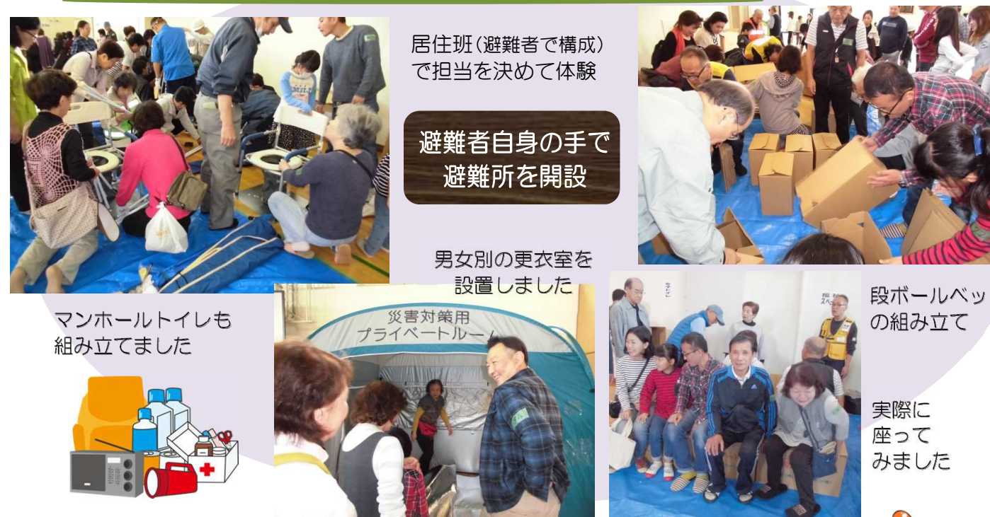
居住班(避難者で構成)で担当を決めて体験