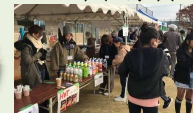
ペットボトルキャップ 35kgを回収しました