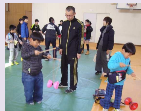
平成29年度 ジャグリング無料体験