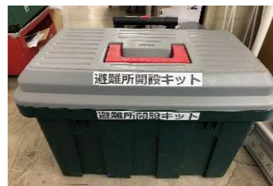
避難所開設キット 外見

防災訓練に合わせて、避難場所の開錠から避難所開設可能かの安全確認と、マンホールトイレ設営までのファーストステップを、長岡京市防災・安全推進室で準備していただきました。実際に使用した結果をもとに、少しでも役立つものにしていければと思っています。