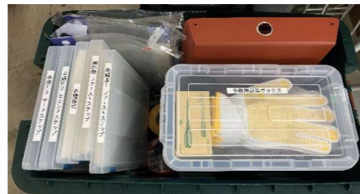
開設キット ふたを開けた状態