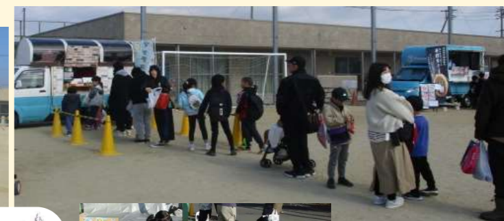
初出店 キッチンカーに 長い行列が出来ました