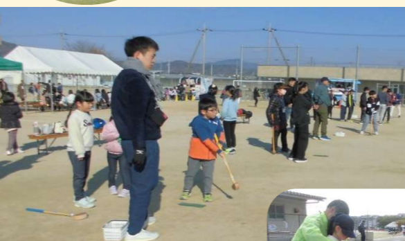
ホールインワンゲーム