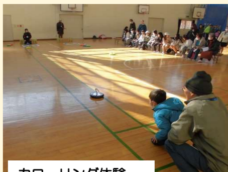
カローリング体験