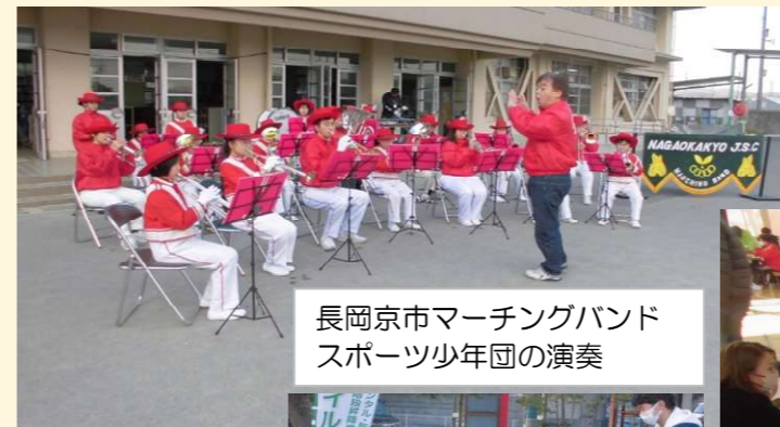
長岡京市マーチングバンド スポーツ少年団の演奏

令和5年12月21日(木) 20:00~20:40 少年補導委員長十小支部の呼びかけで、防犯委員・地域コミュニティ協議会の役員も参加し年末の校区パトロールを行いました。