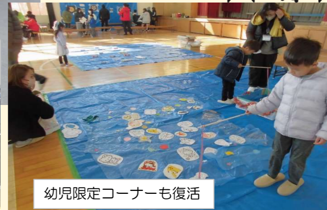
幼児限定コーナーも復活