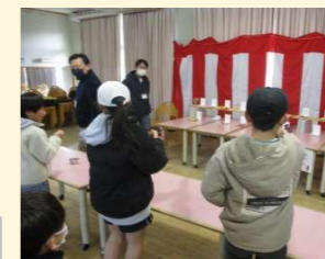
お抹茶コーナーも復活